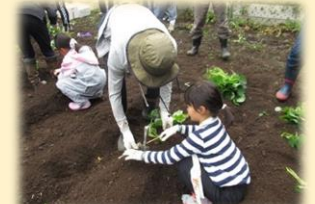
かんも苗植え体験