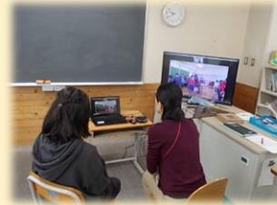
大賀郷小オンライン交流