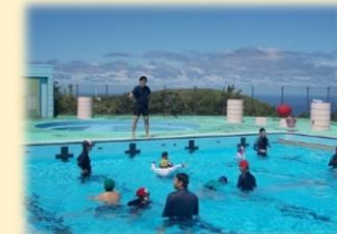
合同水泳・着衣泳