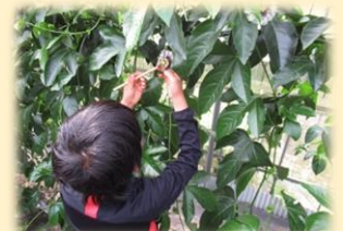
パッションフルーツ収穫体験