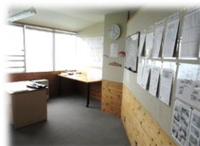
中学校ホームベース