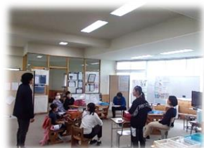
小学校ホームベース

中学生は登校後、各学年のホームベースに集合します。学年ごとに朝のホームルームを行い、担任、副担任の先生の話聞き、各教科のオープンスペースに移動して学習します。道徳や学級活動を学年合同で行うなど、多様な意見を交流しながら学び合う機会を作るなど、協働的な学びの充実に取り組んでいます。